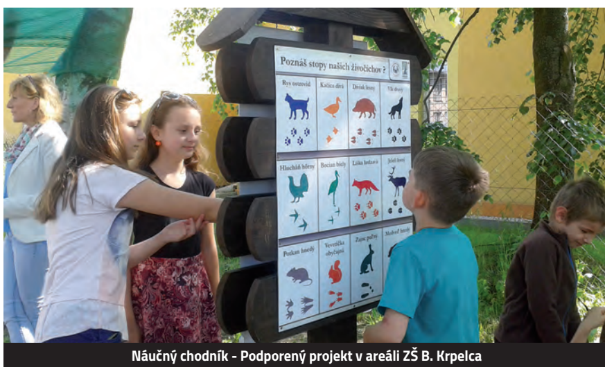
Náučný chodník - Podporený projekt v areáli ZŠ B. Krpelca