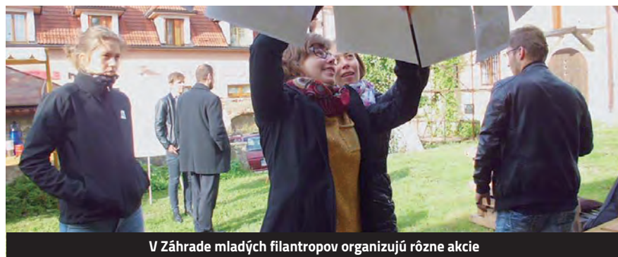
V Záhrade mladých filantropov organizujú rôzne akcie

V tomto roku podporili Mladí filantropi v rámci svojho rovnomenného grantového programu 4 projekty svojich rovesníkov v celkovej sume 575 eur. Medzi podporené projekty patrí: