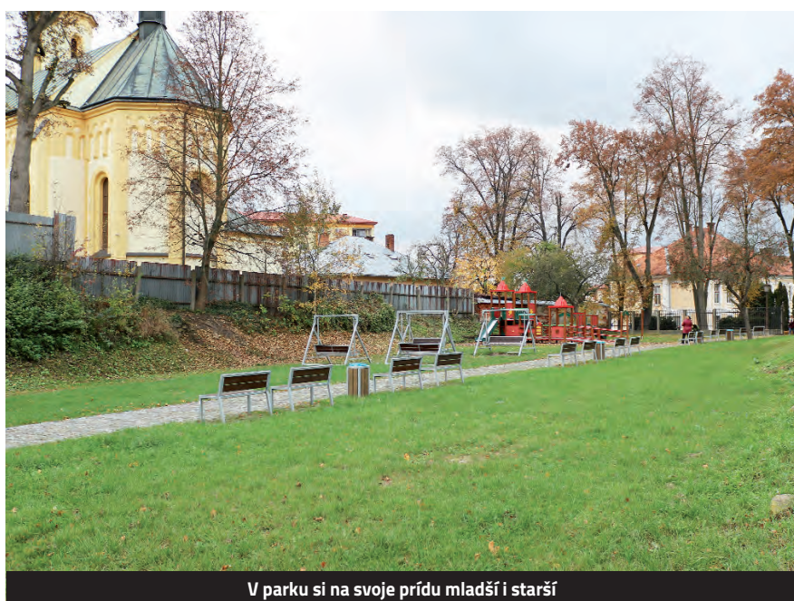
V parku si na svoje prídu mladší i starší