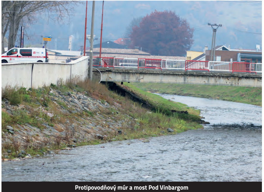
Protipovodňový múr a most Pod Vinbargom

aj podstatne drastickejšie. Jedna vec je rast extrémov, ktoré vznikajú v pohorí Čergova a v ďalších oblastiach, no druhá vec je vlastne to technické riešenie, ktoré spôsobuje veľmi veľké riziko na tom premostení Pod Vinbargom, lebo prietochný