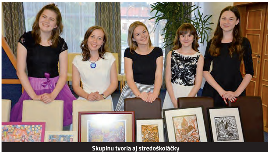
Skupinu tvoria aj stredoškôlčky

A toto im môžeme ponúknuť práve my. Ako Mladí filantropi máme možnosť samostatne spravovať svoj vlastný grantový program a tak podporiť predložené projekty aktívnej mládeže v Bardejove.