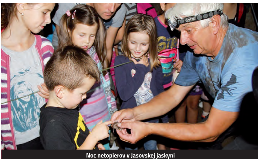
Noc netopierov v Jasovskej jaskyni

Občianske združenie Spoločnosť pre ochranu netopierov (SON) je mimovládnu organizáciu sídliacou v Bardejove. Členov má po celom Slovensku. Medzi nimi sú profesionálni zoológovia, ochranári, ale aj študenti, jaskyniari, či nadšenci rôznych zameraní a veku.