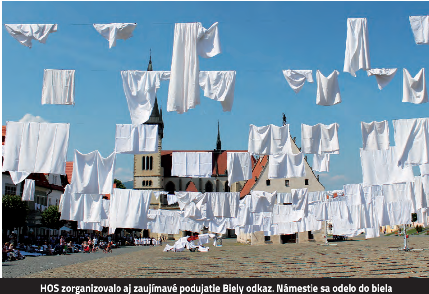
HOS zorganizovalo aj zaujímavé podujatie Biely odkaz. Námestie sa odelo do biela

Cieľom HOS je vytvárať podujatia rodinného typu, najčastejšie aj s výchovným charakterom. Snažíme sa osloviť všetky vekové skupiny a výsledky