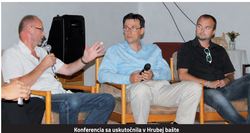
Konferencia sa uskutočnila v Hrukej bašte