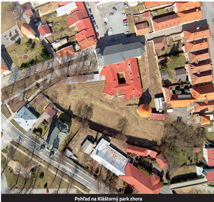
Pohľad na Kláštorň park zhora

Popri obnove okolia je samozrejme veľmi dôležité myslieť i na obnovu budovy kláštora, kláštornej bašty a mestského opevnenia, ktoré lemuje hradobnú